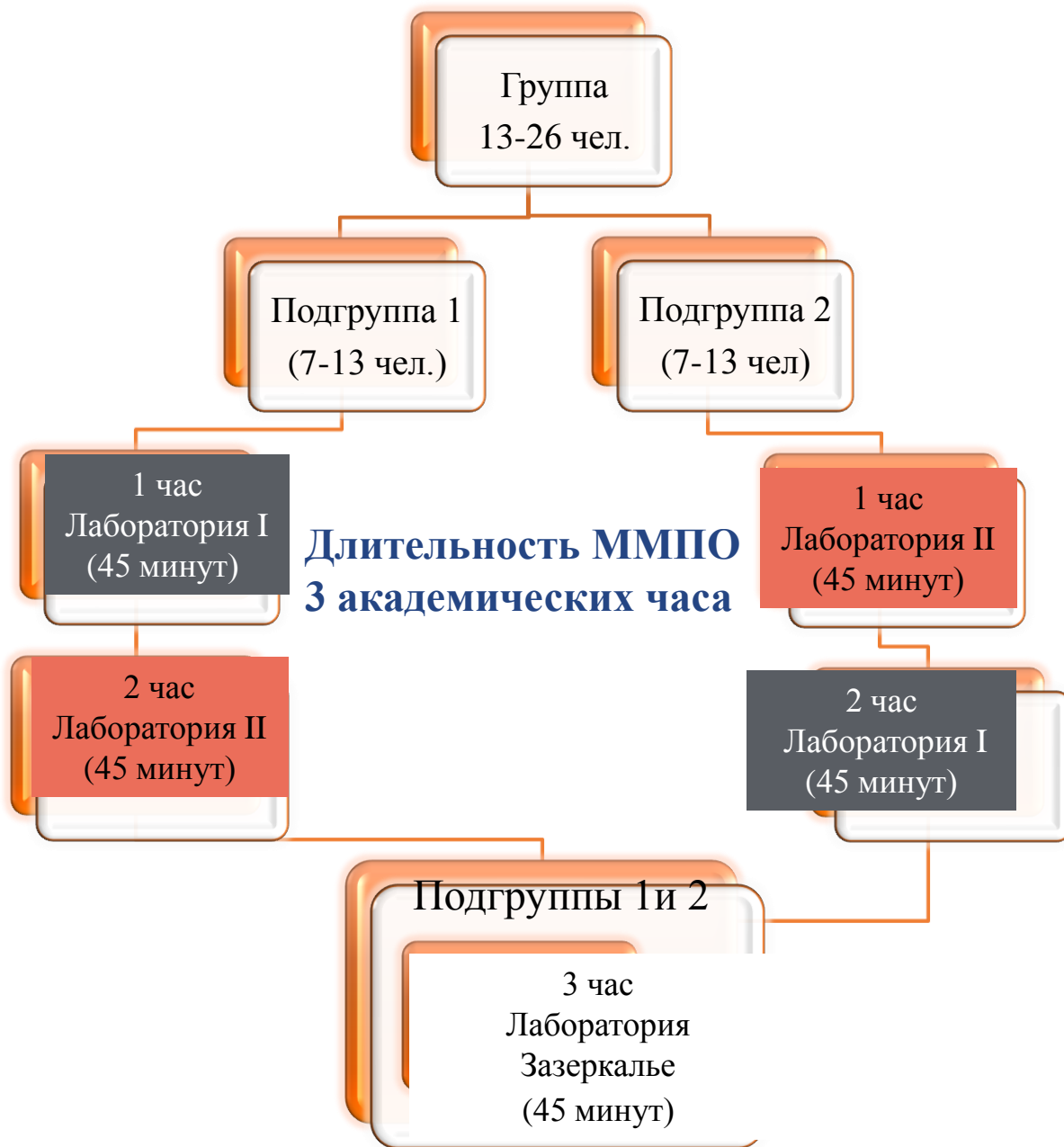
Схема обучение в лабораториях по подгруппам